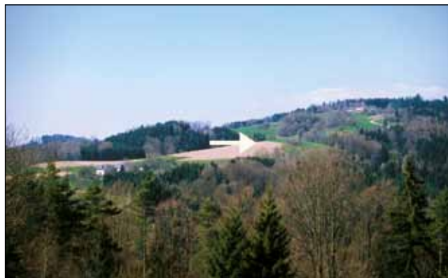
Abb. 15: Lage eines Brutreviers in Elmböckalm/Rechberg mit Getreidefeldern auf Kuppe, von Wald umgeben