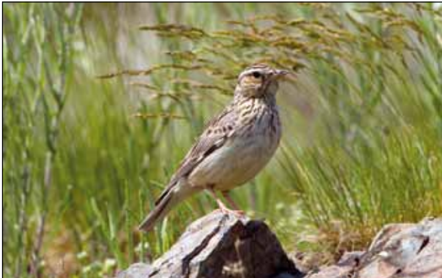
Abb. 3: adulte Heide-Lerche: erkennbar unter anderem am hellen Überaugenstreif und schwarzweißen Fleck am Flügelbug