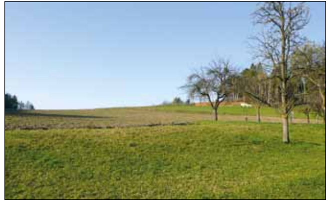
Abb. 10: Bruthabitat zum Neststandort der Abb. 9. Nest im Acker zwischen Waldrand und Obstbäumen