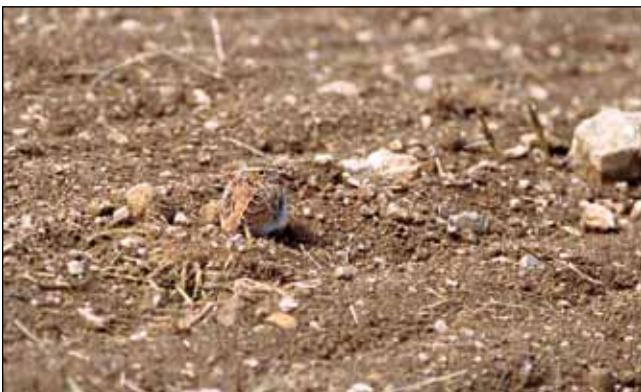
Abb. 1: Juvenile Heidelerche auf der Pammer Höhe: ein fast perfektes Tarngefieder

Dazu kommt, dass neuerdings noch andere verwandte, ornithologische Raritäten ganz vereinzelt in Oberösterreich auftauchen. Für Kaland-, Kurzzehen- und Ohrenlerche liegen seit 2005 zehn anerkannte Nachweise von Durchzugsgästen vor (PFLEGER 2011). Bedenkt man, dass im Bundesland jährlich weit verbreitet 10.000 bis 20.000 Paare der Feldlerche, jedoch kleinräumig nur 50 bis 100 Paare der Heidelerche brüten, lässt sich alleine daraus eine Antreff-