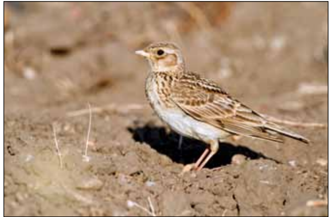
Abb. 4: Feldlerche (juvenil): optisch nicht immer leicht von der Heide-Lerche zu unterscheiden

wahrscheinlichkeit gut ableiten. Die noch Anfang des 20. Jahrhunderts verbreitet vorkommende „wegen ihres wohlschmeckenden Fleisches eifrig verfolgte“ Haubenlerche (WEIGL 2003), dürfte hier inzwischen völlig ausgestorben sein (Abb. 2).