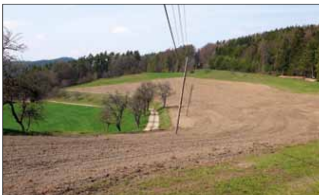
Abb. 16: Typischer Brutplatz am Roadlberg mit Acker in Waldnähe, Weg, Böschung, Einzelbäumen und Stromleitung