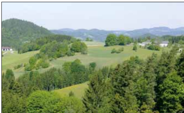
Abb. 14: Typischer Brutplatz auf Kuppen bei Pehersdorf in Schönan: ein Wald-Acker-Grünland-Konglomerat.