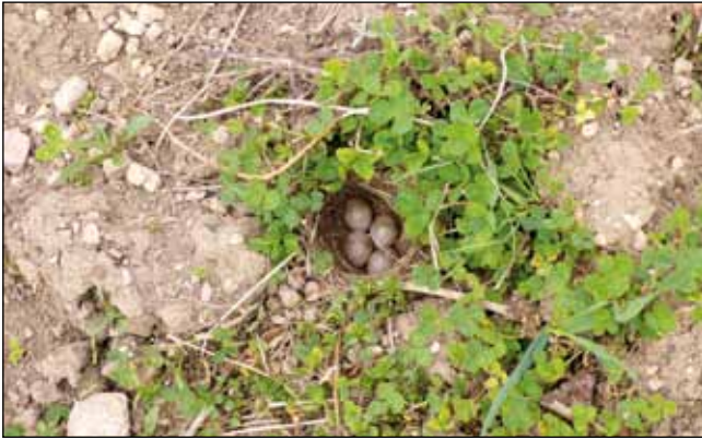
Abb. 9: Erstgelege in einem unbewirtschafteten Gerstenacker am 8. 4. 2007, Schall bei Neumarkt