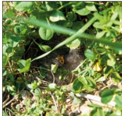
Abb. 13: Jungvögel des gleichen Nestes am 20. 4. 2007; flügge Junge werden am 30. 4. bestätigt.

Vegetationsaufwuchs rasch abnimmt. Die Geschichte im nebenstehenden Kasten verdeutlicht, welche Probleme unter anderem zu bewältigen sind, damit die Heidelerche in unseren landwirtschaftlich genutzten Habitaten erfolgreich Nachwuchs reproduzieren kann.