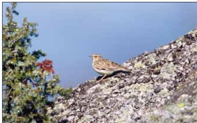
Abb. 8: Adulte Heidelerche: besiedelt im Mühlviertel abwechslungsreiche Lebensräume

Einzelpaare kommen darüber hinaus in Kaltenberg, Unterweißenbach und Gutau vor. Südlich der Großen Naarn schließen die zum Teil tiefer gelegenen Brutvorkommen (500-730 m) zwischen der Linie Mönchdorf/Staub und Rechberg-Pammerhöhe im Norden und Münzbach-Hofberg bis unter St. Thomas im Süden an. Die am tiefsten gelegenen Reviere zeigen das dichtere Verbreitungsbild, mit 7 Revieren auf 5,5 km 2 (1,3 Reviere/km 2 ). Noch wenige Jahre zuvor weiter östlich gelegene besiedelte Hügelkuppen (Mitt. F. Kloibhofer u. H. Leitner) waren 2007 verwaist.