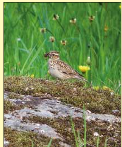
Abb. 5: Futter tragende Heide-Lerche, nutzt einen Granitstein, um eine BirdLife Exkursion zu beobachten.

Brutbiologie: Geschlechtsreife im 1. Lebensjahr. Nest auf dem Boden gut versteckt, meist in Sichtweite der nächsten Bäume, die als Singwarten dienen. Legebeginn Ende März bis Juni, 3-6 Eier, Brutdauer 12-13 Tage (länger bei witterungsbedingter Unterbrechung), nur das Weibchen brütet, beide füttern die Jungen, diese bleiben 10-12 Tage im Nest, werden dann noch 2 Wochen gefüttert. In Mitteleuropa meist 2 Jahresbruten; mehrere Ersatzgelege möglich (BAUER u. a. 2005).