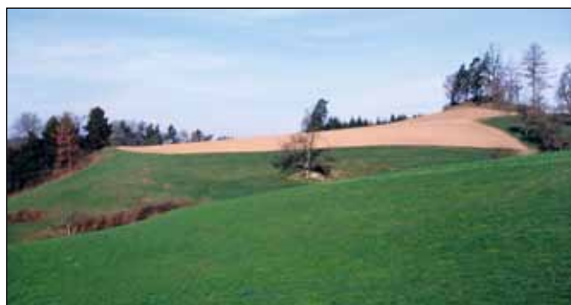
Abb. 19: Wiederholt besiedeltes Bruthabitat auf einer Kuppe mit Maisanbau bei Wansch/Rechberg