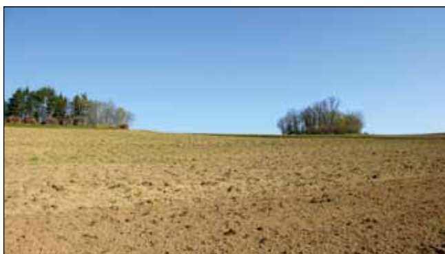
Abb. 18: Bruthabitat in Baumgarten/Neumarkt

Im Gegensatz zu vergangenen Jahrzehnten meidet die Heidelerche zurzeit von Grünland dominierte Landschaftsabschnitte, vermutlich aufgrund ihres stetig zunehmenden, flächendeckend hohen Nährstoffgrades, der zu einer dichten und verfilzten Grasschicht führt. So kommt die Heidelerche mittlerweile kaum mehr in mit kleineren Landschaftselementen reich gegliederten, südexponierten Wiesenhängen vor, die noch vor wenigen Jahrzehnten