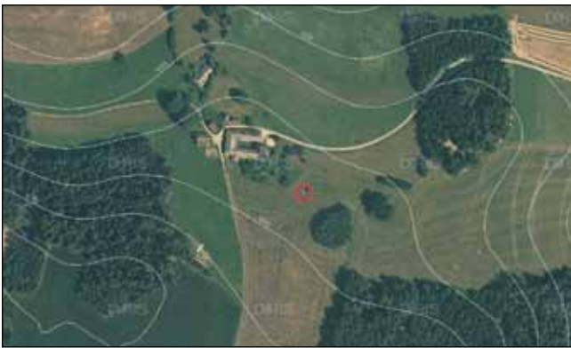
Abb. 11: Luftbild zum Nest Abb. 9 zeigt die Lage in enger Verzahnung von Acker, Wald und Landschaftselementen; Karte: DORIS Atlas