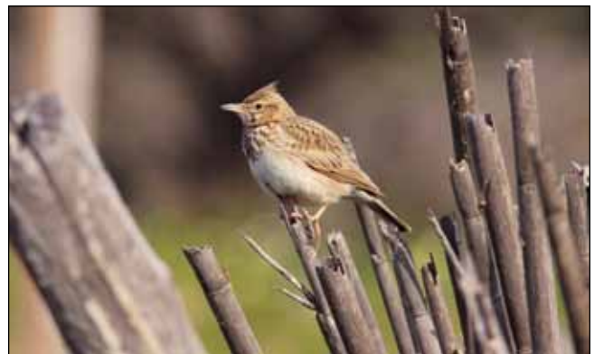
Abb. 2: Haubenlerche: In Oberösterreich als Brutvogel ausgestorben