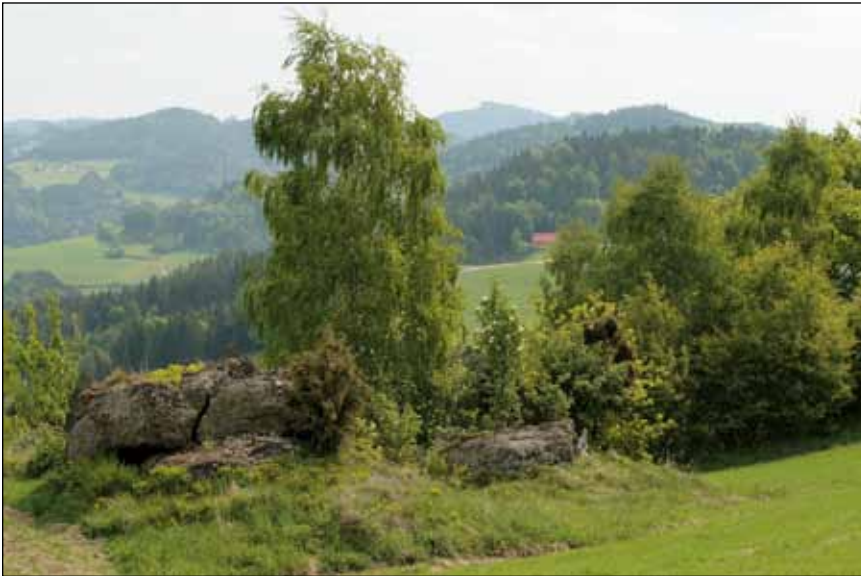
Abb. 24: Landschaftselemente (Pammer Höhe) dienen als Sing- und Warnwarten.

entdecken, gehört zu den schönsten Naturerlebnissen im Mühlviertel – auch weil ihre Lebensräume für uns Menschen so stimmungsvolle, zum Verweilen und Lauschen einladende Plätze bieten.