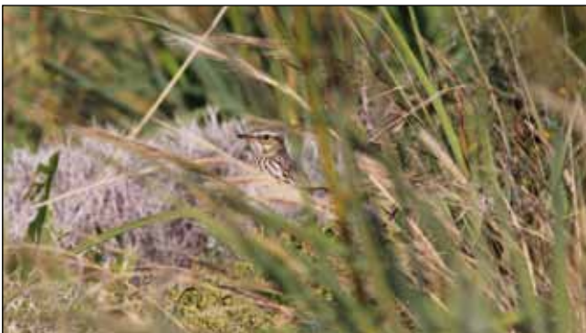
Abb. 20: Heidelerchen nehmen Nahrung nur vom Boden in lückiger oder sehr niedriger Vegetation auf. Foto (Aufnahme in Kreta): H. Uhl

Ein schönes neues Beispiel für die hohe Plastizität der Heidelerche liefern aktuelle Zahlen aus dem Vogelschutzgebiet „Wachau-Jauerling“. In dieser Region liegt das wichtigste Produktionsgebiet für Christbäume in Österreich. Ein Forschungsprojekt im Rahmen des Schutzgebietsmanage-