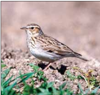
Abb. 22: Heideleerche in ihrem im Mühlviertel bevorzugten Lebensraum Acker.

ments hat nun gezeigt, dass während der Phase einer Expansion der Christbaumkulturen auch die Brutbestände der Heideleerche deutlich zugenommen haben. Diese Vogelart kann den offenen Boden bzw. die sehr kurze Vegetation zwischen den Setzlingen zur Nahrungsaufnahme gut nutzen sowie die Spitzen der Bäumchen als Singwarte. Allerdings gilt dies bevorzugt für Kulturen in den ersten 3 bis 5 Jahren. Danach nimmt die Eignung der Kulturen für die Heideleerche wieder ab (FRÜHAUF u. a. 2011).