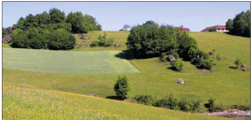
Abb. 23: Zur Nachahmung empfohlen: Flächen im Naturpark Mühlviertel, für die die Bewirtschafteter fünfjährige „Heideleerchen-Verträge“ eingegangen sind.

Die künftigen Bestandstrends der Heideleerche im Mühlviertel hängen demnach von vielen Faktoren ab, die zum Teil in Wechselwirkung zueinander stehen. Im Bereich Landnutzung wäre das negativste Szenario eine Aufgabe des kleinräumigen Getreidebaus, verbunden mit einer Aufforstung oder die Umwandlung dieser Flächen in Intensivgrünland. Das würde wohl den endgültigen regionalen Niedergang der Heideleerche zur Folge haben, sollten keine alternativen Bruthabitate entstehen (siehe oben). Auch die