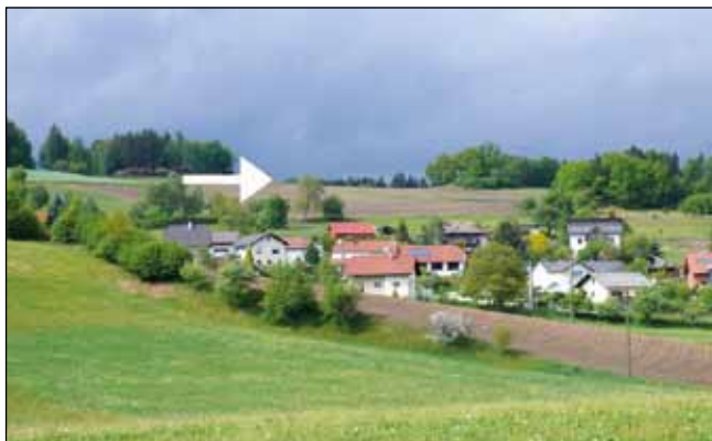
Abb. 7: Lage eines Brutreviers in Neumarkt/Baumgarten mit Getreidefeld auf Kuppe