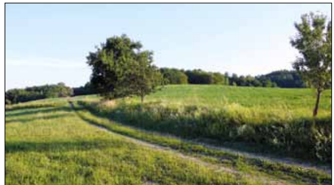
Abb. 21: Revier in Greifenberg: unbefestigte Feldwege stellen wertvolle Habitatrequisiten dar.